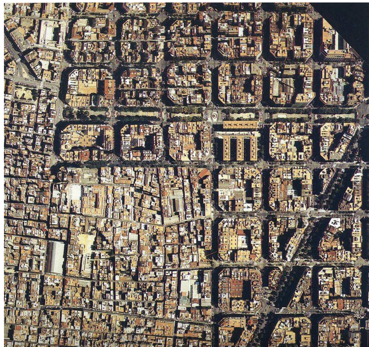
תמונה מס' 7: המרקם המורכב, קומפקטי והצפוף של תוכנית סארדה