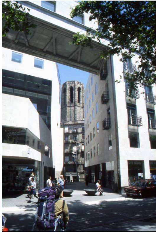
תמונה מס' 6: ברצלונה, השיח בין ארכיטקטורה עכשווית והיסטורית

נוצר קומפלקס רב-שכבתי, בו בעת מ.ע.ר. ייחודי, מרכז תרבות, חינוך ופנאי ורובע מגורים בעל צפיפות גבוהה. בלב אזור ה"אישמפלה" – ששטחו כ- 9 קמ"ר – מתגוררים 375,000 תושבים ויש בו 300,000 מקומות עבודה. מורכבות זאת מאפיינת, מינונים שונים, את העיר כולה.