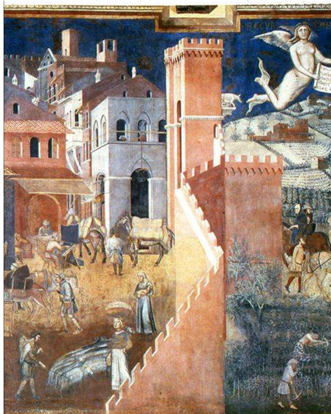
תמונה מספר 3: אמברוג'ו לורנצטי "תוצאות הממשל הטוב" 1328 בקירוב

צורתה של סיינה מזוהה עם השלד של חללים ציבוריים הנושאים את חיי היום-יום והאירועים המזדמנים והמחזוריים של תושבים ואורחים, החל מהשוק הפתוח בפאתי העיר עד לבניין הראשי של הבנק האזורי – הראשון באירופה - במרכז. מוסדות הדת – קתדרלה וכנסיות, מוסדות החברה האזרחית, המסחר על רמותיו - מהמעדנייה עד הסופרמרקט, סדנאות אמנים ואומנים, האקדמיה למוסיקה בעלת המוניטין העולמי, משכנן של האגודות המשתתפות במרוץ ה"פאליו" המפורסם, מתקני ספורט והאיצטדיון העירוני, תחנת האוטובוסים הבינעירוניים, מגורים ואכסניות, גנים וכיכרות - כל אלה, "מהמנזר ועד מועדון הלילה" -מרכיבים את מכלול החללים הציבוריים ומגבשים יחידה אורבנית רציפה.