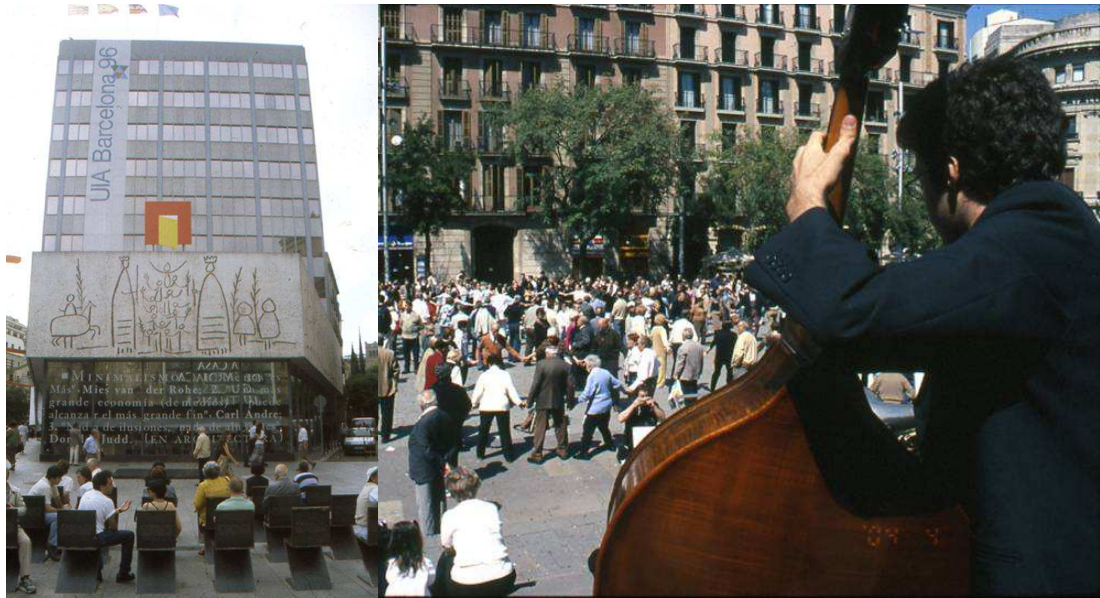
תמונה מס' 4 ו-5: ברצלונה, המרחב הציבורי כבמה תרבותית

כבר עם תחילת יישומה של התכנית, לחצים דמוגרפיים וספקולטיביים הביאו לנטישת חלק מהפרמטרים שנקבעו לבלוק הפתוח: זה הפך לסגור, החצר הפנימית הפכה לשטח בנוי,