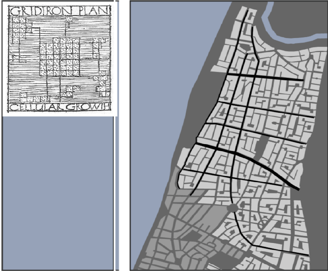
תמונה מס' 8: תל אביב של ג.דס. הבלוק האורבני, יחידה פיזית-חברתית